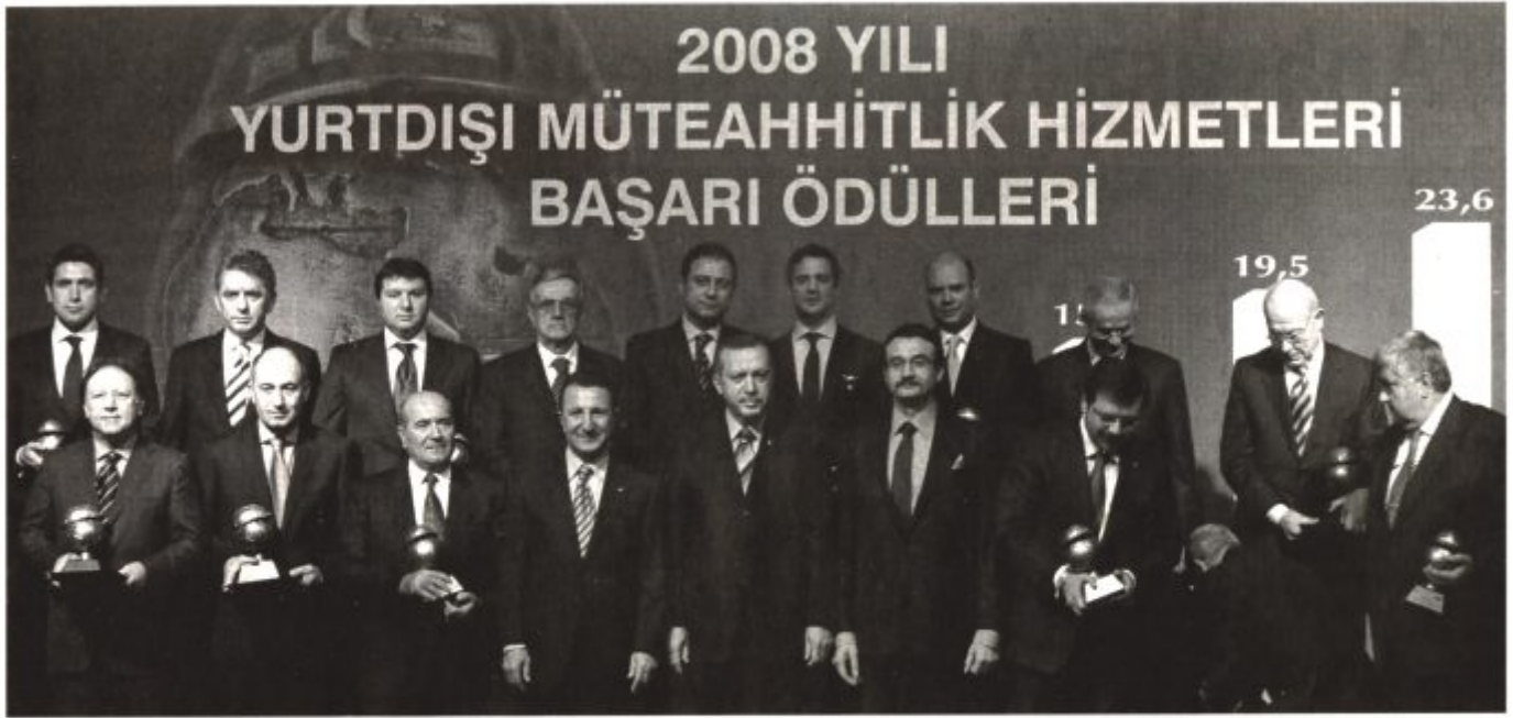
Dünyanın en büyük 225 müteahhit firması arasına giren Türk şirketlerinin temsilcilerinin ödülleri Başbakan Erdoğan ve Devlet Bakanı Tüzmen verdi. Ödül alan firmalar şunlar: Enka, Gama, Renaissance, Tekfen, Yüksel, Kayı, Baytur, TAV, Nurot, Mak-Yol, STFA, Hazinedaröğlü, Summa, GAP, Yeniçün, Cengiz, Rasen, Doğuş, Alarko, Mesa, Yaşar Özkan, TML, Üstay.