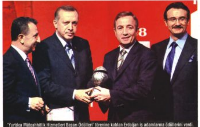
"Yurtdışı Müteahhitlik Hizmetleri Başarı Ödülleri" törenine katılan Erdoğan iş adamlarına ödülleri verdi.

İş adamlarına seslenen Başbakan Tayyip Erdoğan krizden çıkış yolunun, birbirine suç atmaktan değil fırsatları görüp yatırım yapmaktan geçtiğini söyledi