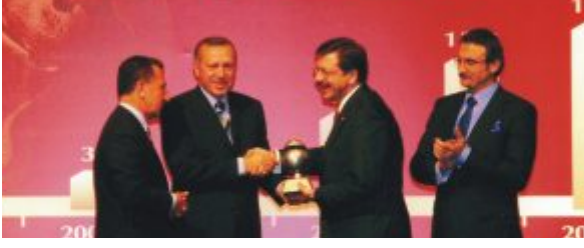
M. Rifat HİSARCIKLIOĐLU, TOBB BaŐkanı